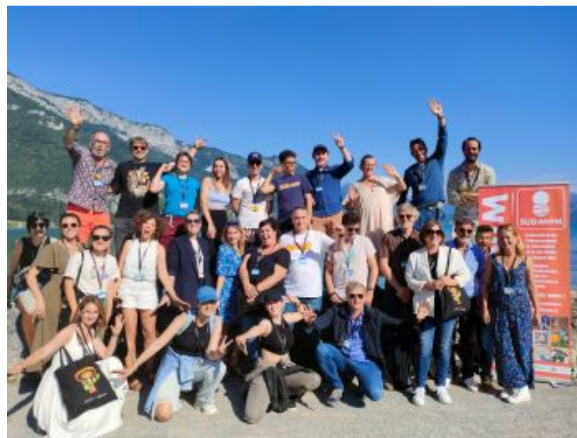
Une partie des membres de SudAnim se réunit chaque année à l'occasion du Festival d'Annecy (ici 2023)